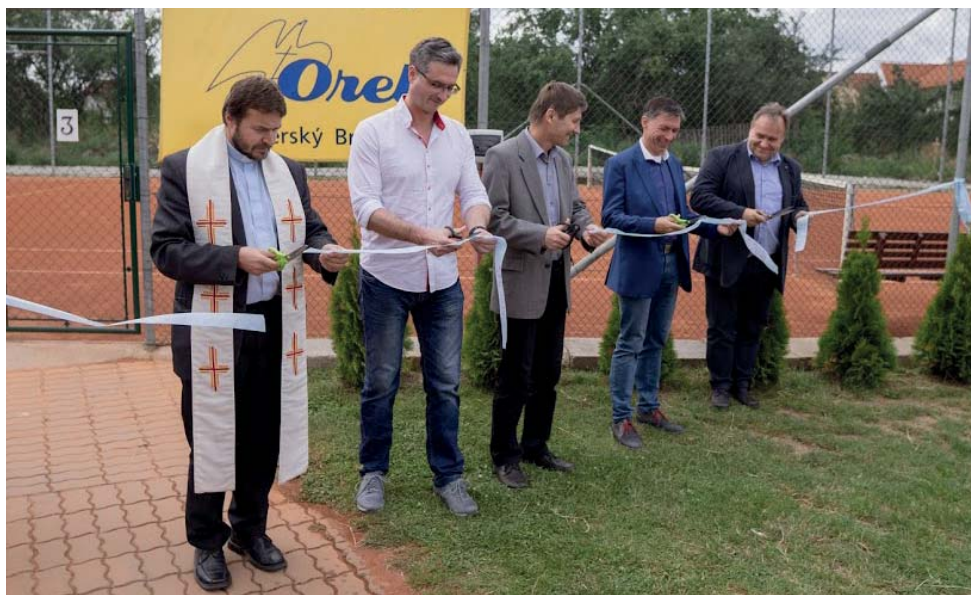
Slavnostní otevření nového antukového tenisového kurtu